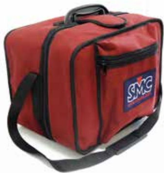
Bolsa ligera de Transporte