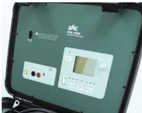
Voltaje independiente opcional PTE-FCN